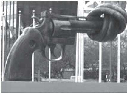
Karl Fredrik Reuterswardin taideteos YK:n päämajan edessä.